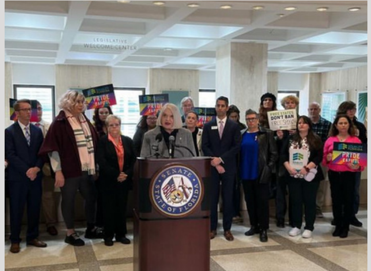
Senadora Stewart habla en la conferencia de prensa de la comunidad LGBTQ+ y aliados de Florida contra la legislación discriminatoria

Proyectos de ley como Don't Say Gay 3.0 (HB 599/SB 1382) y la Prohibición de la Bandera LGBTQ+ (HB 901/SB 1120) apuntan y dividen aún más a los floridanos en función de quiénes son y a quién aman.